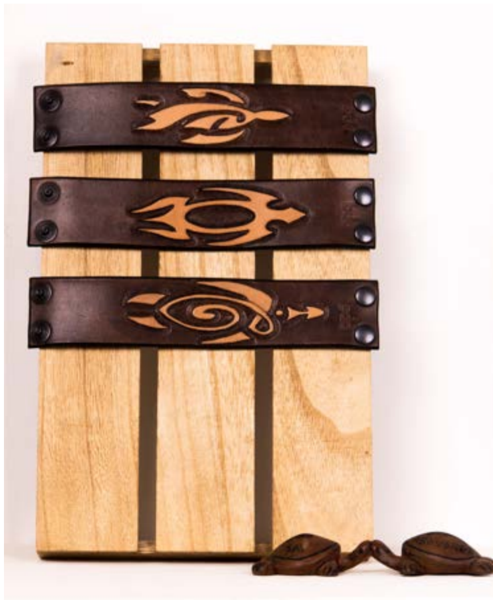
Turtle Line- BDD Creations - Leather Carving Art - ©BDD - Made in Italy