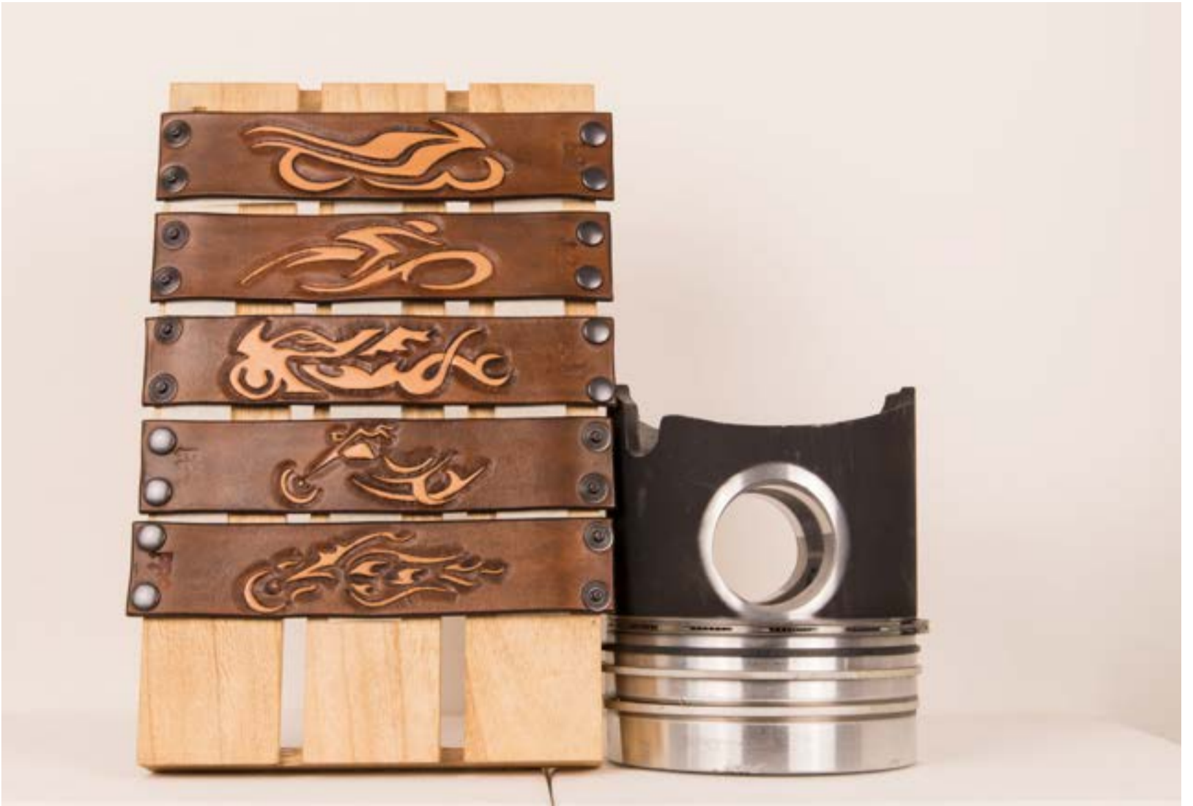
Motorcycle Line - BDD Creations - Leather Carving Art - ©BDD - Made in Italy