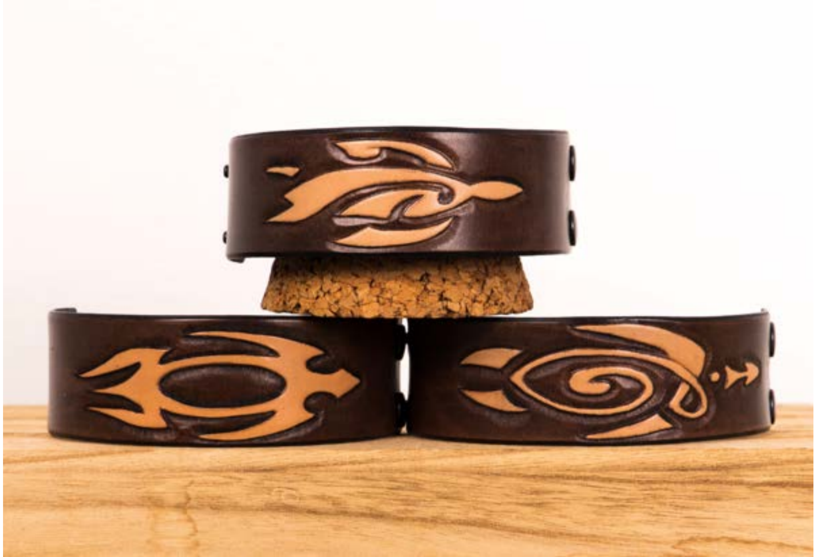
Turtle Line- BDD Creations - Leather Carving Art - ©BDD - Made in Italy