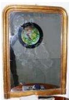
17- Specchiera a cabaret. Dorata a foglia, specchio originale. Manifattura francese di epoca e stile Napoleone III, terzo quarto del XIX sec.