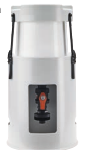
Abb.: Einfüllereinrichtung mit Universaladapter