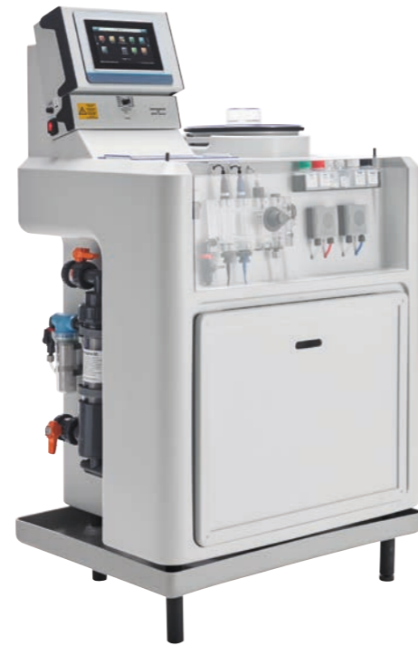
Abb.: GRANUDOS-FLEX-CPR TOUCH XL mit Dosiereinheit 5 kg

Darüber hinaus sind diverse Optionen, wie beispielsweise eine innovative Einfüllereinrichtung mit Universaladapter, separat erhältlich.