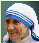
Madre Teresa di Calcutta

Infine quando tutte le cose finite si dissolveranno e tutto sarà chiaro, che io possa essere stato il debole ma costante riflesso del tuo amore perfetto .