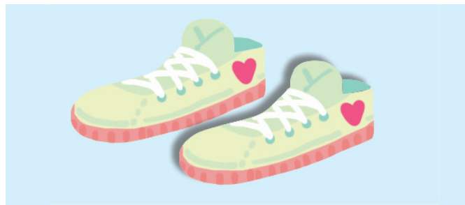
SCARPE DA GINNASTICA