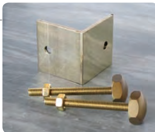
SQUADRETTA DI FISSAGGIO

COLONNINE LUCIDE CON DADI RINGHIERINA LUCIDA AD UNA PIEGA RINGHIERINA LUCIDA A DUE PIEGHE BORCHIETTE LUCIDE Ø 30 mm PIATTINA OTTONE RINFORZO 8 x 3 mm SQUADRETTE FISSAGGIO