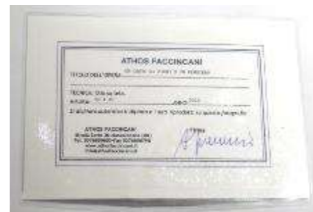
11 Athos Faccincani “Un cesto di fiori e un pensiero” dipinto ad olio su tela. Misure tela cm h. 50x40. 50+40=90x1x10= Valore commerciale € 900,00