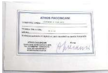
2 Athos Faccincani "Santorini e sole alto" dipinto ad olio su tela. Misure tela cm h. 30x30. 30+30=60x1x10= Valore commerciale € 600,00