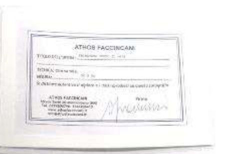
5 Athos Faccincani "Primavera verso il mare" BBG 998 A Facciani. Dipinto ad olio su tela. Misure tela cm h. 30x50. 30+50=80x1x10= Valore commerciale € 800,00