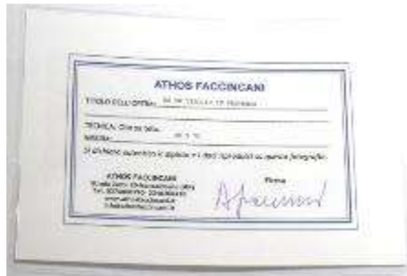
14 Athos Faccincani "Da un viaggio in Provenza" dipinto ad olio su tela. Misure tela cm h. 30x70. 30+70=100 \times 1 \times 10 = Valore commerciale € 1000,00