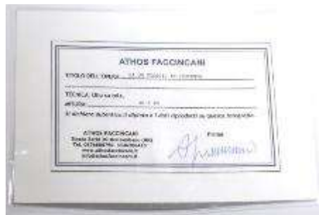
10 Athos Faccincani “Da un viaggio in Provenza ” dipinto ad olio su tela. Misure tela cm h. 40x40. 40+40=80x1x10= Valore commerciale € 800,00