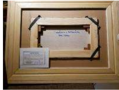
6 Athos Faccincani. "Santorini e romantiche rose rosse"

Misure tela cm h. 30x50. 30+50=80x1x10= Valore commerciale € 800,00