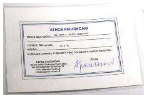
13 Athos Faccincani . “Tra luce e poesia a Positano” Misure tela cm h. 30x70. 30+70=100x1x10= Valore commerciale € 1000,00