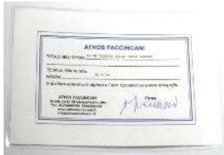
12 Athos Faccincani “Da un viaggio nelle isole greche” dipinto ad olio su tela. Misure tela cm h. 50x50. 50+50=100x1x10= Valore commerciale € 1000,00