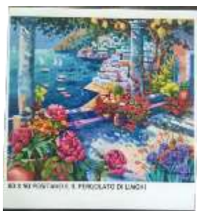
20 Athos Faccincani. Positano e il pergolato di limoni Misure tela cm h. 80/90. 80+90=170x1,2x10= Valore commerciale € 2.040,00