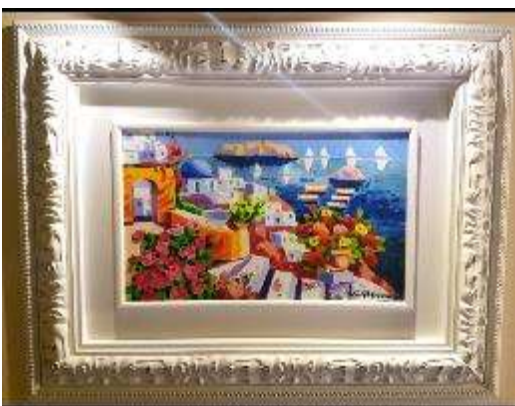
9 Athos Faccincani. "I colori e i profumi a Santorini"

Misure tela cm h. 30x50. 30+50=80x1x10= Valore commerciale € 800,00