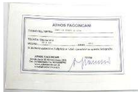
3 Athos Faccincani "Vasi di fiori e luce" BBG 1778 di mio autentico A Faccincati dipinto ad olio su tela. Misure tela cm h. 30x40. 30+40=70x1x10= Valore commerciale € 700,00