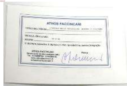
15 Athos Faccincani. "L'angolo delle riflessioni intorno a Positano" Misure tela cm h. 60x60. 60+60=120 \times 1 \times 10 = Valore commerciale € 1200,00