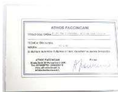
18 Athos Faccincani “E la tra i papaveri cerco le case bianche” dipinto ad olio su tela. Misure tela cm h. 80x80. 80+80=160x1,2x10= Valore commerciale € 1.920,00