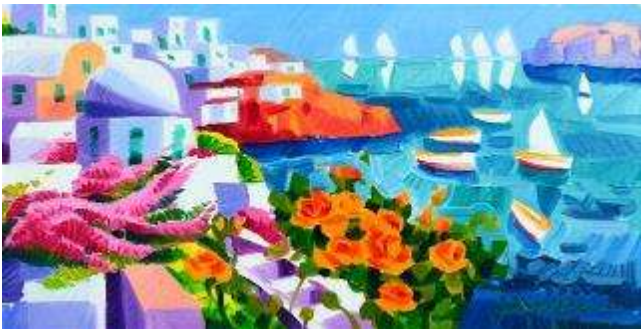
7 Athos Faccincani. "La terrazza dei sogni a Santorini"

Misure tela cm h. 30x50. 30+50=80x1x10= Valore commerciale € 800,00