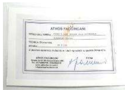
17 Athos Faccincani "Fiori e luce intorno alla cattedrale Alexander Nevshy" dipinto ad olio su tela.

Misure tela cm h. 60x100. 60+100=160 \times 1,2 \times 10= Valore commerciale € 1.920,00