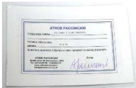
4 Athos Faccincani "Tra sogni e fiori Positano" dipinto ad olio su tela. Misure tela cm h. 30x50. 30+50=80x1x10= Valore commerciale € 800,00