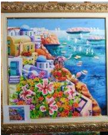
19 Athos Faccincani. Santorini, dove la luce accarezza i fiori Misure tela cm h. 80x80. 80+80=160x1,2x10= Valore commerciale € 1.920,00