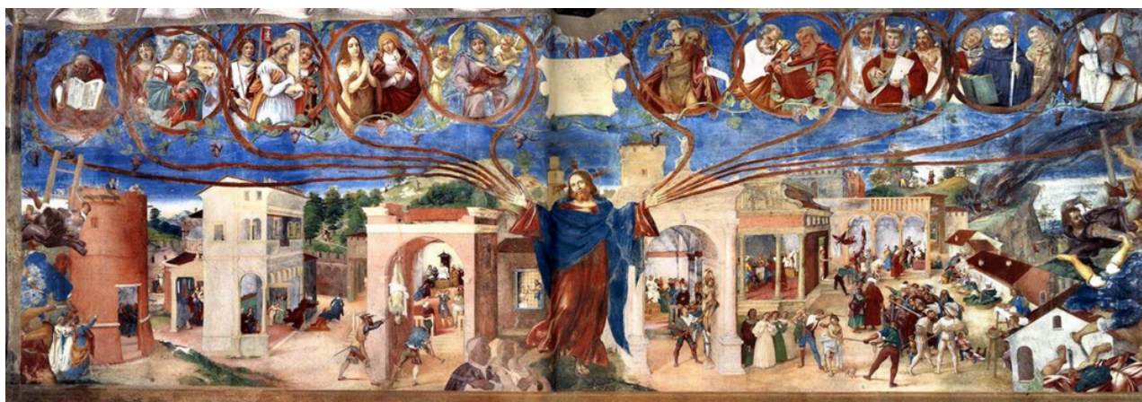
(Cristo-Vite, Lorenzo Lotto, Cappella Suardi, Bergamo, 1524)