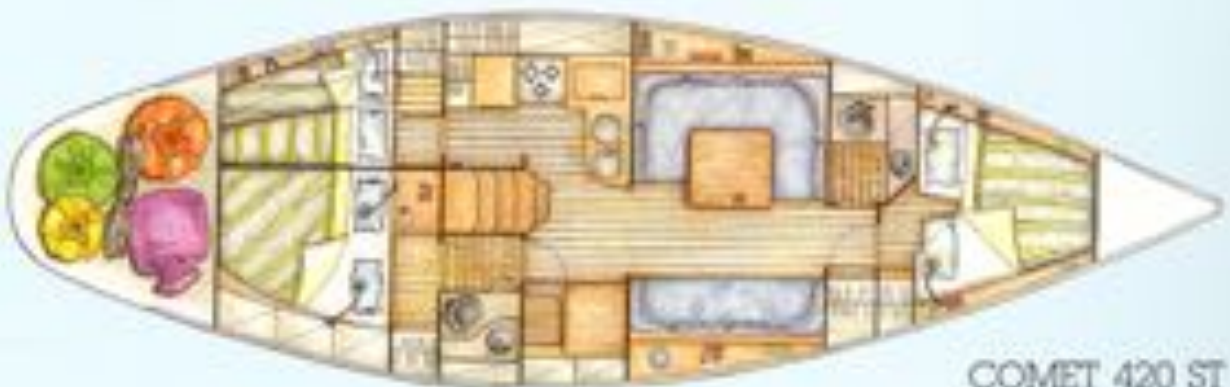
COMET 420 ST