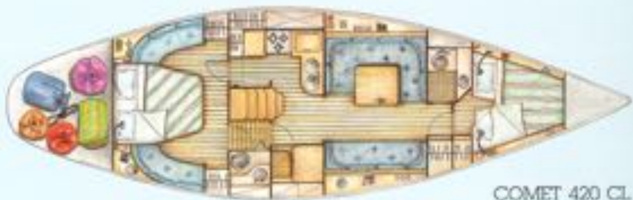
COMET 420 CL