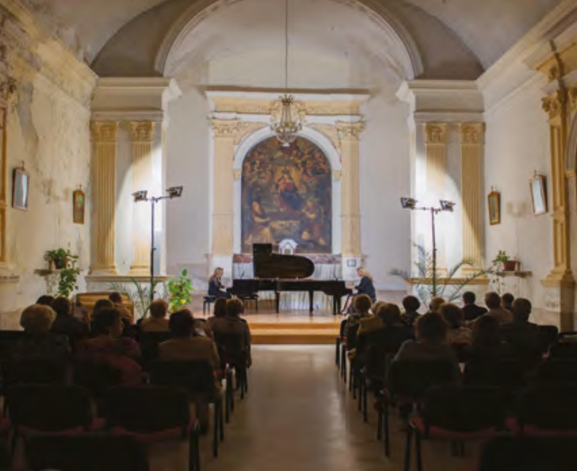
CHIESA DELL'ITRIA Termini Imerese