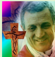
Don Tonino Bello

Testimone Come possiamo dire parole di pace, se non sappiamo perdonare? Con quale coraggio pretendiamo che siano credibili le nostre scelte di pace a livello di massimi sistemi, quando nel nostro entroterra personale prevale la legge del taglione? Come possiamo rifiutare la "deterrenza" e respingere la logica del missile per missile, se nella nostra vita pratichiamo gli schemi dell'occhio per occhio e dente per dente"? Quali liberazioni pasquali vogliamo annunciare, se siamo protagonisti di stupide smanie di rivincita, di deprimenti vendette familiari, di squallide faide di Comune? Chi volete che ci ascolti quando facciamo comizi sulla pace, se nel nostro piccolo guscio domestico siamo schiavi dell'ideologia del nemico? Solo chi perdona può parlare di pace. E a nessuno è lecito teorizzare sulla non violenza o ragionare di dialogo tra popoli o maledire sinceramente la guerra, se non è disposto a quel disarmo unilaterale e incondizionato che si chiama "perdono".