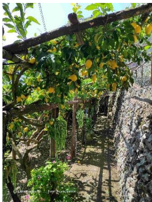
Sentiero dei Limoni