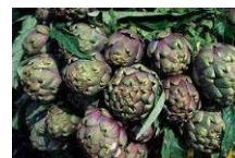
Carciofo I.G.P. di Paestum