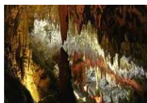
GROTTE DI PERTOSA (KM. 69)