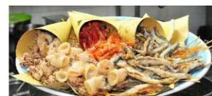
Frittura di pesce