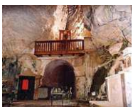
GROTTE DI CASTELCIVITA (KM. 29)