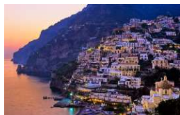
COSTIERA AMALFITANA (KM. 50)