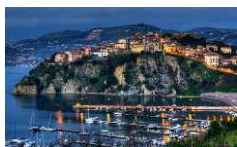
PROMONTORIO DI AGROPOLI (KM. 8)