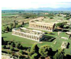
Vista panoramica di Paestum