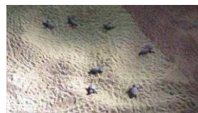
Tartarughe Caretta Caretta sulla spiaggia di Torre di Mare