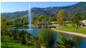
PARCO OASI FIUME AENTO (KM. 23)