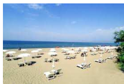
Spiaggia attrezzata di Torre di Mare