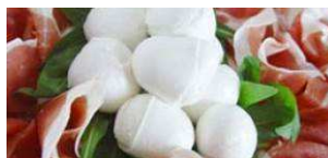
Mozzarella di bufala di Paestum DOP