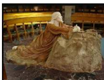
SANTUARIO GETSEMANI (KM. 7)