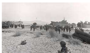
Operazione Avalanche sett. 1943