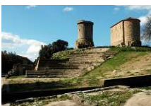
SCAVI ARCHEOLOGICI DI VELIA (KM. 44)