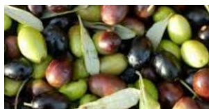
Olio extravergine di oliva