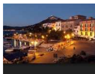
SANTA MARIA DI CASTELLABATE (21 KM.)