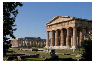
Tempio di Nettuno - Paestum