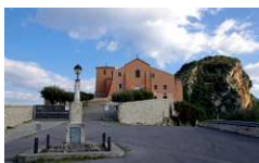
SANTUARIO MADONNA DEL GRANATO (KM. 11)