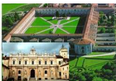
CERTOSA DI PADULA (KM. 105)