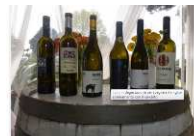
Vini di Paestum