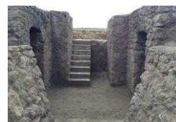
Bunker/ trincea sulla spiaggia di Paestum