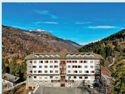
COLONIA COMERIO, APRICA