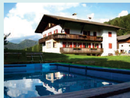
CASA ZICKERHOF - GUDON DI CHIUSA