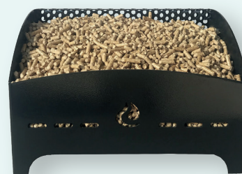
MOD. 1 - Kg. 5 Cm. 32x21x22