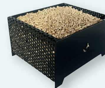
MOD. 4 - Kg. 5,5 Cm. 30x25x15