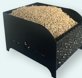
MOD. 3 - Kg. 6 Cm. 23,5x30,5x20