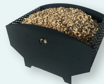
MOD. 2 - Kg. 6 Cm. 33x32x16,5