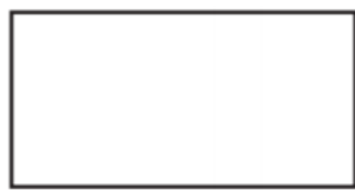
Location of the software operator relative to the site.