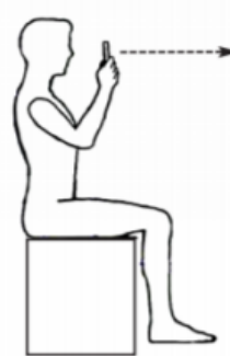
The location of the operator