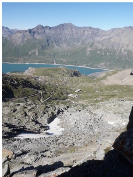
Dal Malamot il lago Moncenisio