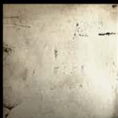
Oro + Platino B