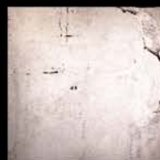
Rame + Platino B