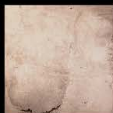
Bronzo + Platino E