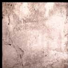
Rame + Platino A