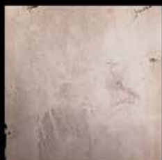
Bronzo + Platino A