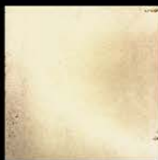
Oro + Platino E