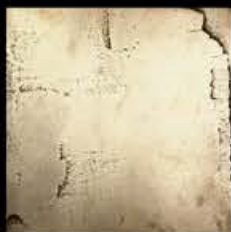
Oro + Platino A