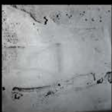
Palladio + Platino A