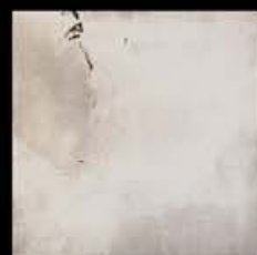
Bronzo + Platino B

I colori di questo catalogo sono indicativi, poiché riprodotti tipograficamente; per garantire una più affidabile resa cromatica è indispensabile l'uso del catalogo real Effect. The colours reproduced in this catalogue may differ slightly from their originals; for more faithful colour reproduction, use a real Effect catalogue.