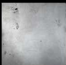
Palladio + Platino B