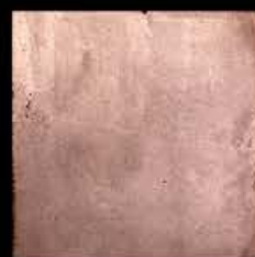
Rame + Platino E