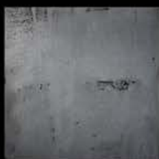
Palladio + Platino E