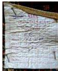
16- Tappeto persiano Bijar. Vecchia manifattura.