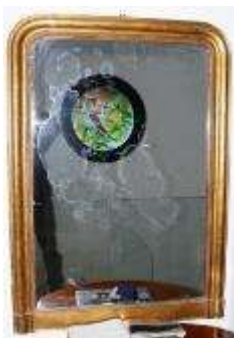
17- Specchiera a cabaret. Dorata a foglia, specchio originale. Manifattura francese di epoca e stile Napoleone III, terzo quarto del XIX sec.