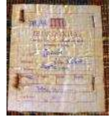
15- Tappeto persiano SAROU-GH. Vecchia manifattura.