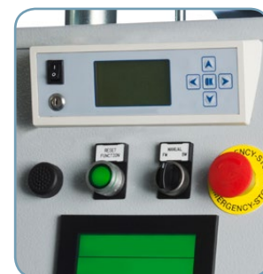
Sistema di controllo aggraffatura QC5