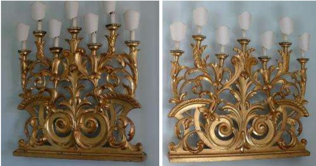
16 - Coppia di appliques a sette luci in legno intagliato a volute e racemi e dorato a foglia d'oro. Manifattura emiliana moderna. Misure cm 80x87. Prezzo di rimpiazzo € xxxx,00