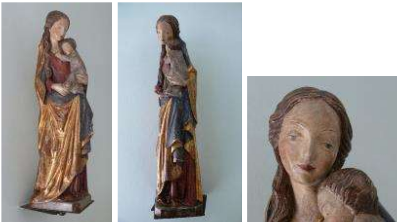
18 - Madonna e Gesù Bambino. Scultura intagliata su legno e dipinta a mano in policromia, mantello di ottima qualità di esecuzione è antichizzato con l'uso della foglia d'oro. Manifattura moderna. Scultura antichizzata ad imitazione delle statue antiche fiorentine del XVI secolo. Misure cm 80x20x24. Prezzo di rimpiazzo € xxxx,00