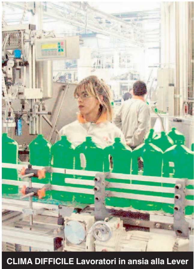
CLIMA DIFFICILE Lavoratori in ansia alla Lever

«Contrarre la produzione è un segno che inevitabilmente avrà ricadute negative»