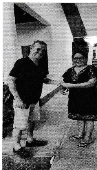
Consegna della donazione 01/04/2022