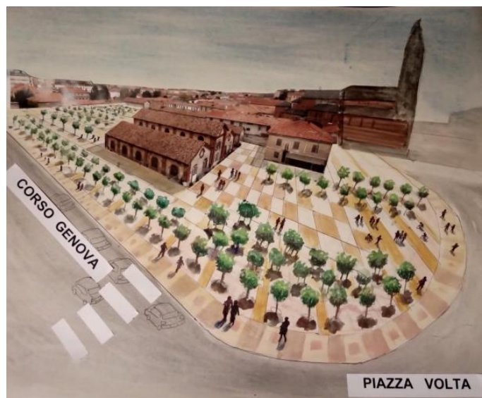
(Disegno di Lino Portalupi)