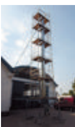
La torre eolica