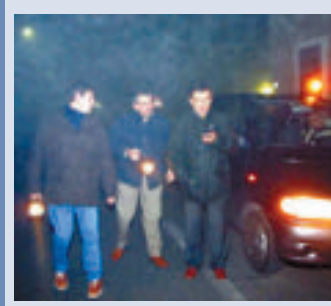
Le ronde organizzate dal municipio