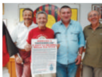
I tifosi con il manifesto dell'iniziativa

I sostenitori del S. Angelo calcio scendono in campo per il sostegno della loro squadra: è partita la sottoscrizione popolare "Santangel100" che attraverso l'acquisto di una tessera consente ai tifosi di aiutare i rossoneri.