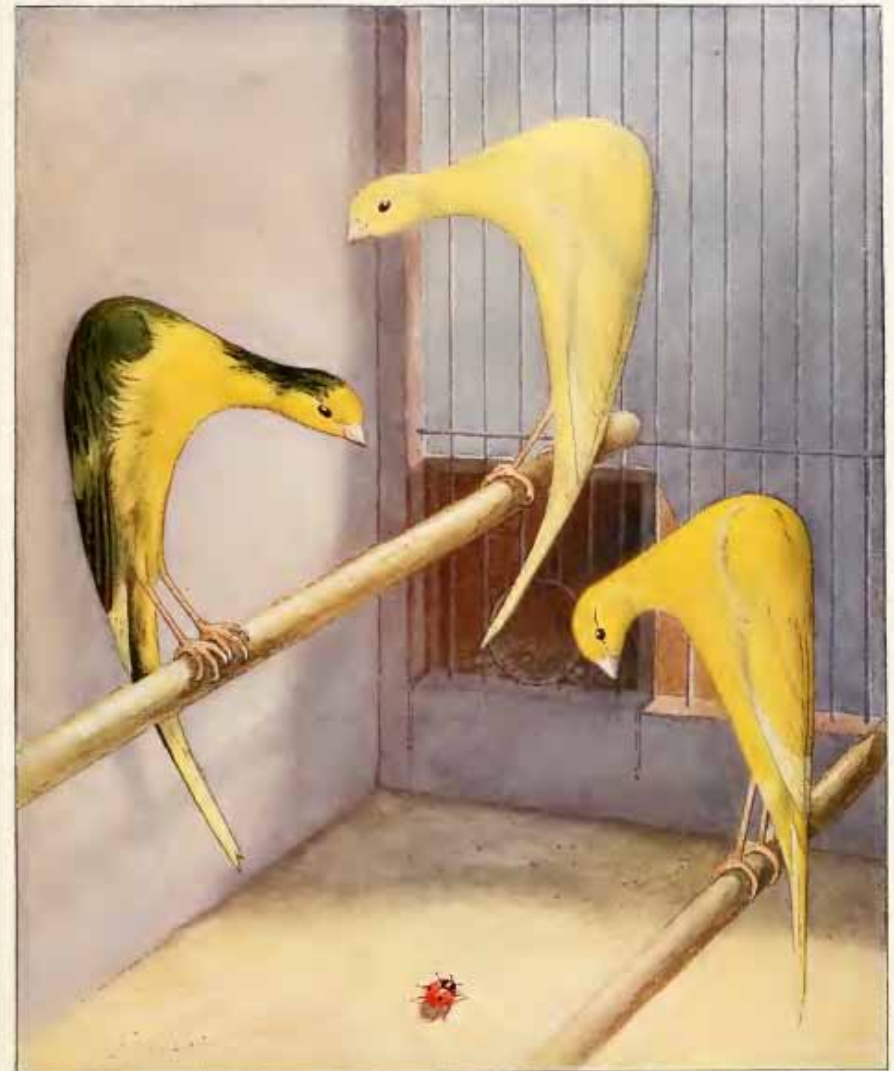
YELLOW PIRBALD SCOTCH FANCY CANARY

Differenze tra gli Scotch Fancy e i Bossu Belga del tempo - Stampa tratta da una pubblicazione del 1911