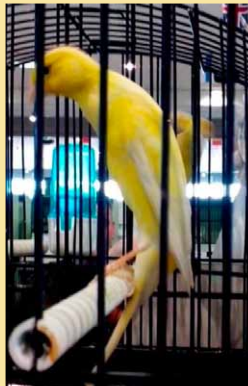
Scotch Fancy giallo brinato