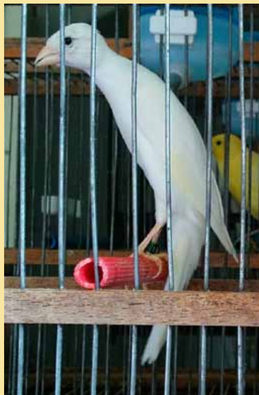
Scotch Fancy bianco dominante

Gli esemplari selezionati per l'arduo compito di ricostruire la razza si dimostrarono rustici e molto prolifici, ragion per cui si diffusero in breve tempo in tutta l'Europa compresa ovviamente l'Italia dove, oggi, la maggiore concentrazione di estimatori si trova nel sud del nostro paese. Fra le tante regioni in cui viene allevato lo Scotch Fancy, una particolare menzione deve essere sicuramente rivolta alla Campania, nella quale, grazie alla competenza ed intuizione allevatoriale dei tanti selezionatori, senza alcun timore di smentita, credo siano allevati i migliori soggetti. È proprio in Campania che, nel 1999, un gruppo di allevatori, accomunati dalla stessa passione per questa magnifica razza,