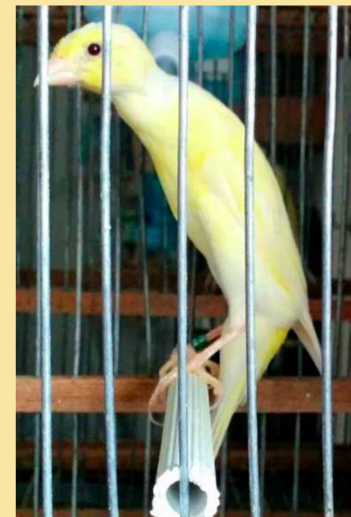
Scotch Fancy giallo brinato

L'esaltazione delle rotondità... lo Scotch Fancy