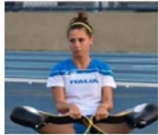
Federica Maspero nei 400 4° alle paralimpiadi di Rio