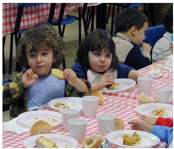
I bambini di Codogno hanno mostrato di gradire la "Giornata del dolce"