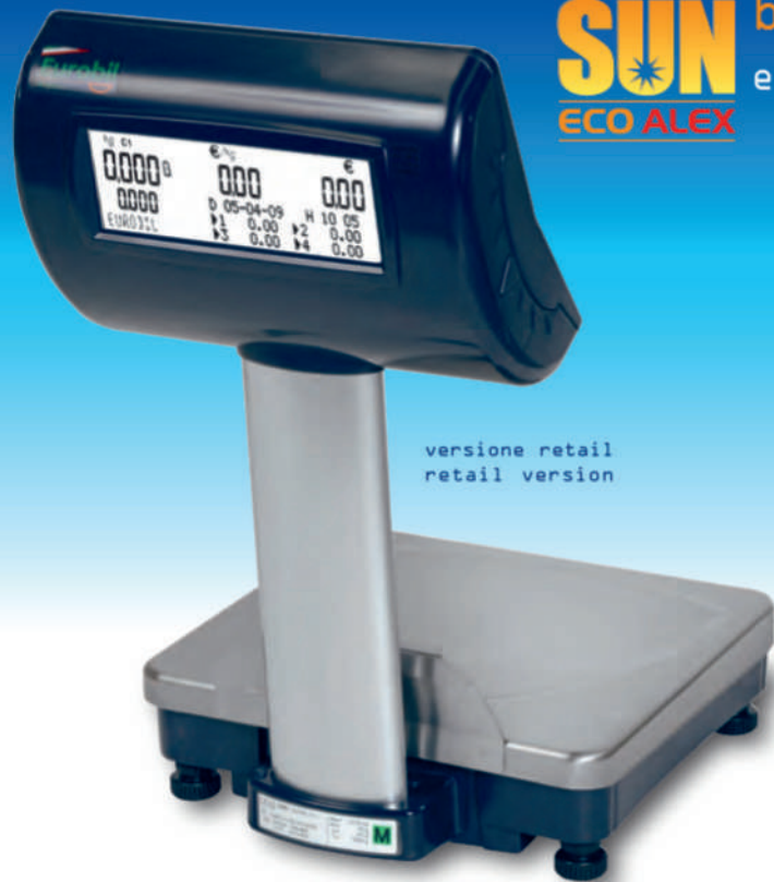
versione retail retail version