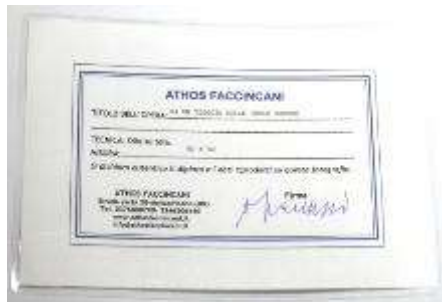
12 Athos Faccincani “Da un viaggio nelle isole greche” dipinto ad olio su tela. Misure tela cm h. 50x50. 50+50=100x1x10= Valore commerciale € xxxx00