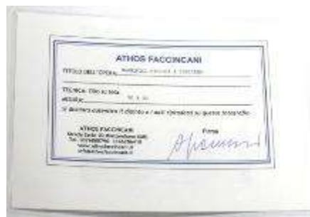
1 Athos Faccincani “Magnifici ricordi a Positano”, dipinto ad olio su tela. Misure tela cm h. 30x30. 30+30=60 \times 1 \times 10= Valore commerciale € xxxx,00