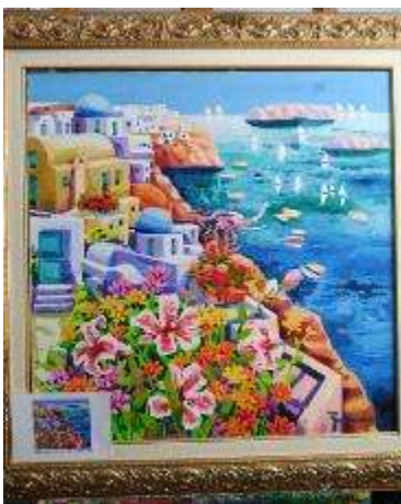
19 Athos Faccincani. Santorini, dove la luce accarezza i fiori Misure tela cm h. 80x80. 80+80=160x1,2x10= Valore commerciale € xxxx00