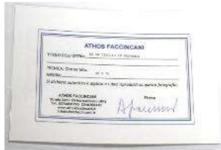
14 Athos Faccincani “Da un viaggio in Provenza ” dipinto ad olio su tela. Misure tela cm h. 30x70. 30+70=100 \times 1 \times 10 = Valore commerciale € xxxx00