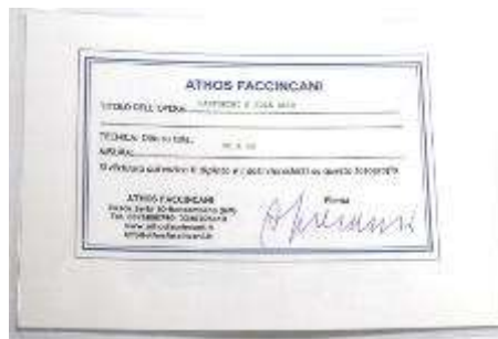
2 Athos Faccincani "Santorini e sole alto" dipinto ad olio su tela. Misure tela cm h. 30x30. 30+30=60x1x10= Valore commerciale € xxxx,00