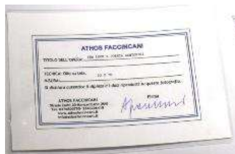
13 Athos Faccincani . “Tra luce e poesia a Positano” Misure tela cm h. 30x70. 30+70=100x1x10= Valore commerciale € xxxx00