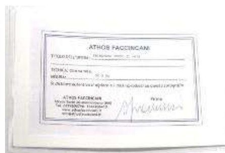
5 Athos Faccincani “Primavera verso il mare” BBG 998 A Facciani. Dipinto ad olio su tela. Misure tela cm h. 30x50. 30+50=80x1x10= Valore commerciale € xxxx,00