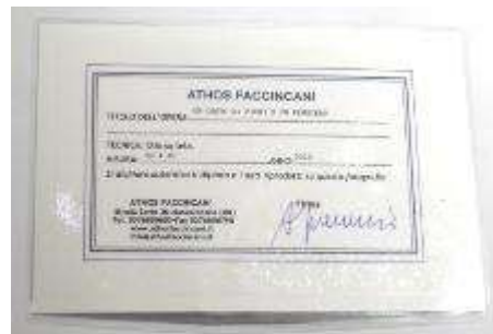
11 Athos Faccincani “Un cesto di fiori e un pensiero” dipinto ad olio su tela. Misure tela cm h. 50x40. 50+40=90x1x10= Valore commerciale € xxxx00