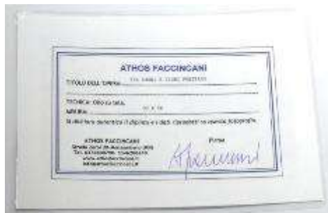
4 Athos Faccincani “Tra sogni e fiori Positano” dipinto ad olio su tela. Misure tela cm h. 30x50. 30+50=80x1x10= Valore commerciale € xxxx,00