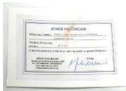
17 Athos Faccincani "Fiori e luce intorno alla cattedrale Alexander Nevshy" dipinto ad olio su tela.

Misure tela cm h. 60x100. 60+100=160 \times 1,2 \times 10 = Valore commerciale € xxxx,00