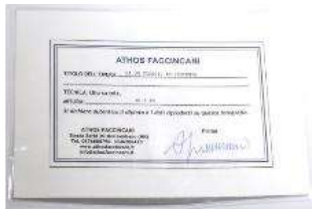
10 Athos Faccincani “Da un viaggio in Provenza ” dipinto ad olio su tela. Misure tela cm h. 40x40. 40+40=80x1x10= Valore commerciale € xxxx00