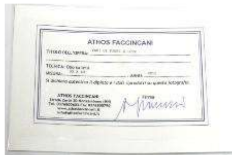
3 Athos Faccincani "Vasi di fiori e luce" BBG 1778 di mio autentico A Faccincati dipinto ad olio su tela. Misure tela cm h. 30x40. 30+40=70x1x10= Valore commerciale € xxxx,00