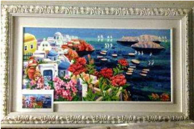
16 Athos Faccincani. Tra fiori e mare a Santorini Misure tela cm h. 50/100. 50+100=150 \times 1,2 \times 10 = Valore commerciale € xxxx00

Dipinti da moltiplicarsi per coefficiente 1,2 (uno, due).