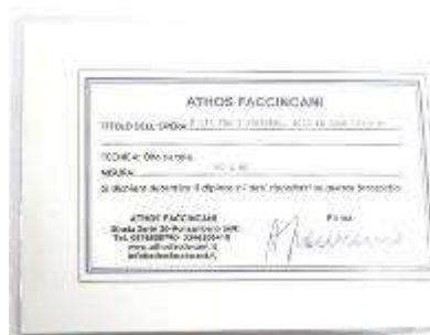
18 Athos Faccincani “E la tra i papaveri cerco le case bianche” dipinto ad olio su tela. Misure tela cm h. 80x80. 80+80=160x1,2x10= Valore commerciale € xxxx00